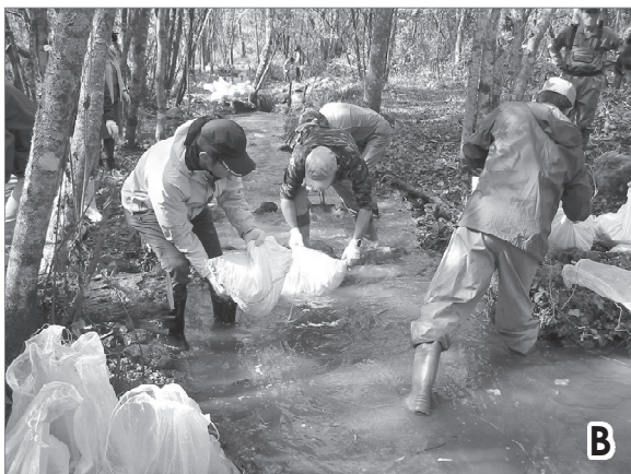
第2図 馬瀬川人工産卵河川 (A) および蒲田川人工産卵河川 (B) における砂利の運搬と敷設作業

整備した。産卵場の整備作業は、岐阜県河川環境研究所（現在は岐阜県水産研究所）が馬瀬川上流漁業協同組合と共同で実施した。整備した6箇所の平均面積および標準偏差は 3.75 \pm 0.59 \text{ m}^2 （範囲 3.00\text{--}4.25 \text{ m}^2 ）で、計 22.5 \text{ m}^2 だった。砂利の運搬状況の調査は、これら全6箇所の産卵場を対象に実施した。馬瀬川人工産卵河川における産卵場の整備作業には、単粒度碎石（粒径 10\text{--}30 \text{ mm} ）を使用した。この砂利は、現場付近の仮置き場から産卵場の整備地点までプラスチックコンテナ（底面内径 60 \text{ cm} \times 40 \text{ cm} 、深さ 40 \text{ cm} ）に入れて運搬した（第2図）。コンテナに入れる砂利の深さは 10 \text{ cm} あるいは 20 \text{ cm} とし、運搬1回あたりの体積を 0.024 \text{ m}^3 あるいは 0.048 \text{ m}^3 とした。上流から1・2・6番目の産卵場には、1回あたり 0.024 \text{ m}^3 を従事者2名で運搬した。3・4・5番目の産卵場は、1回あたり 0.048 \text{ m}^3 を従事者4名で運搬した。各産卵場の砂利の体積は、運搬回数に 0.024 \text{ m}^3 あるいは 0.048 \text{ m}^3 を乗じて算定した。さらに産卵場の面積で除して 1 \text{ m}^2 あたりの砂利の体積を算定した。また、砂利の体積を重量に換算するため、10リットルのバケツを使用して仮置き